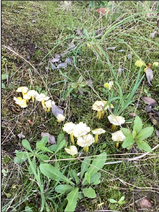
おまけにキノコも顔を出していました