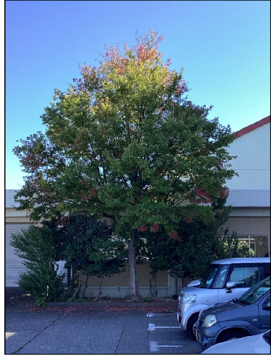
所々色好きはじめ・・・