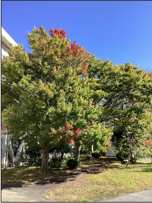
校長の好きな場所の一つです