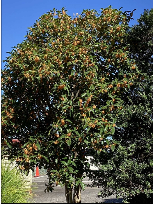
生徒玄関前の金木犀からいい香りが・・・

今朝は今シーズン一番の冷え込みとなり、北海道や盛岡からは初霜や初氷のたよりを聞きました。新津南高校にも秋の気配が訪れ、校庭の木々が色づき始め、素敵な景色を見ることができました。