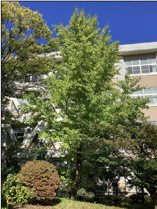
イチョウは緑ですが